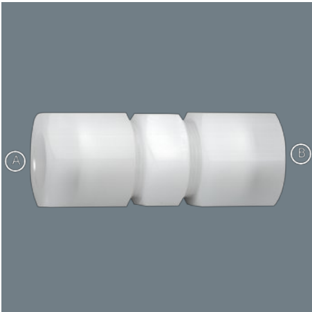
Illustrazione di esempio