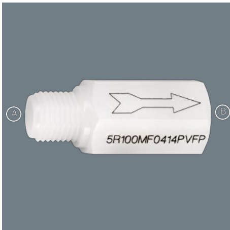
Illustrazione di esempio