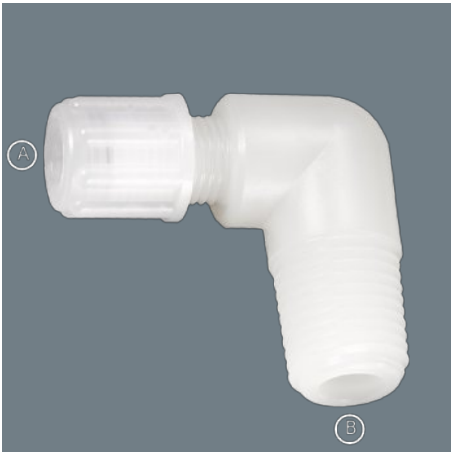
模範的なイラスト