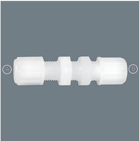
模範的なイラスト